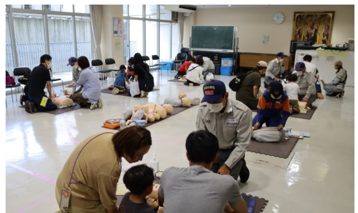
熱心に AED 講習を受ける参加者